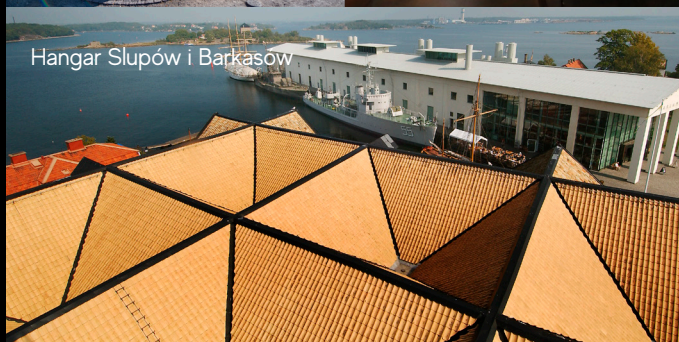
Hangar Słupów i Barkasów