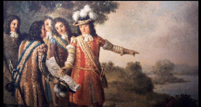
Obraz Pehra Hillerströma przedstawia króla Karola XI, w towarzystwie swoich doradców i admirałów, wskazującego miejsce na budowę Karlskrony

Pod koniec XVII wieku Szwecja była europejską potęgą i zdołała opanować terytoria w północnych Niemiec, Finlandii, Estonii i Łotwy. Szwecja potrzebowała nowej bazy morskiej aby móc bronić tak rozległych obszarów. Szwedzki król Karol XI wybrał, strategicznie wschodnią część archipelagu w Blekinge, na lokalizację nowej bazy marynarki wojennej, Karlskronę.